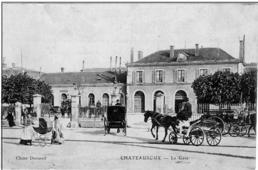
La Gare : le chemin de fer arrive à Châteauroux en 1847