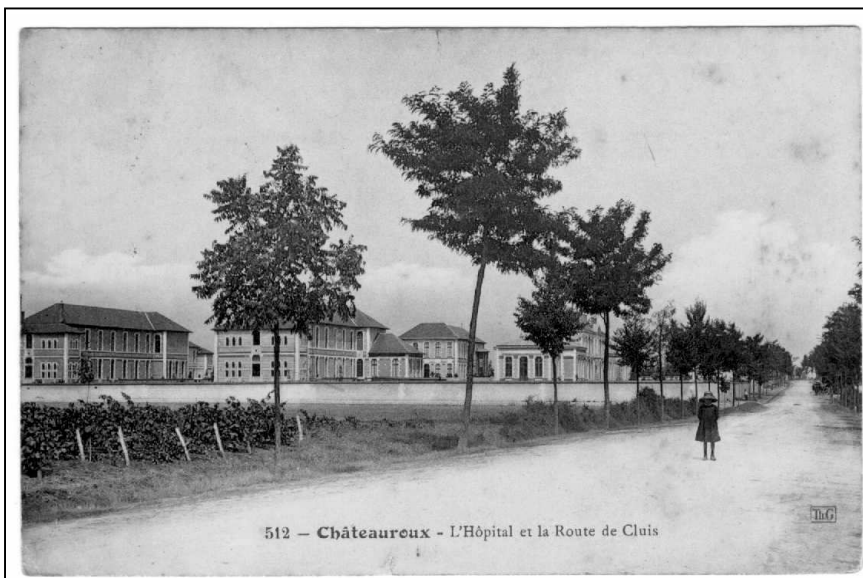
L'hôpital est construit en 1906 en périphérie de la ville.