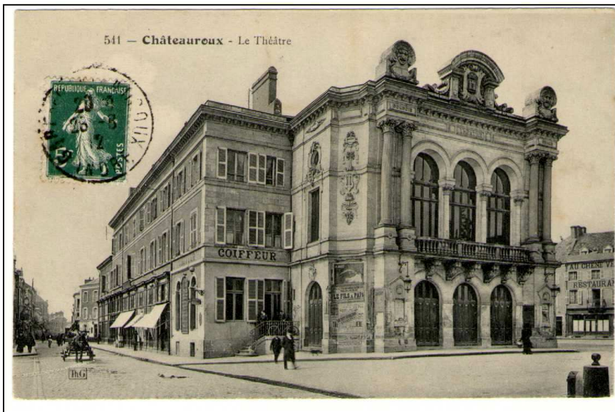
Le Théâtre : construit en 1832, il anime la vie culturelle castelroussine tout au long du 19 e siècle. Des artistes prestigieux s'y produisent tels Sarah Bernard. Fermé en 1952, il est remplacé par la Tour Gambetta, symbole de la présence américaine à Châteauroux.