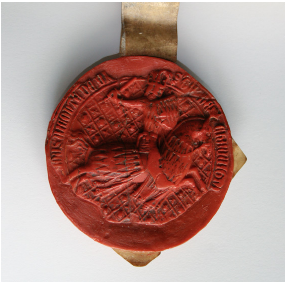
Charte et sceau de cire rouge de 6.5 cm de diamètre, 1462, conservés aux Archives départementales de l'Indre sous la cote G 61

Document : le sceau de Gui III de Chauvigny (1407/1422/1483)