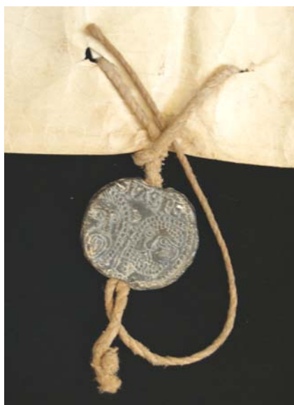
Bulle du pape Calixte III (1455) conservée aux Archives départementales de l'Indre

La cire est faite en cire d'abeille qui est ensuite colorée : verte (vert de gris), noire (noir de fumée ou papier brûlé), ou rouge (plante tinctoriale, l'orcanette)