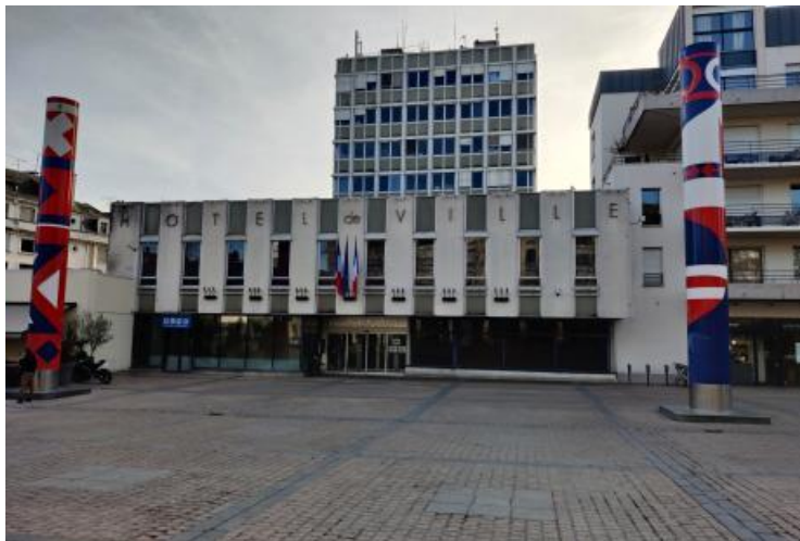
Mairie de Châteauroux