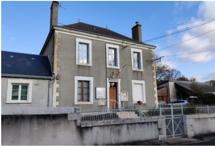
Mairie de Chalais