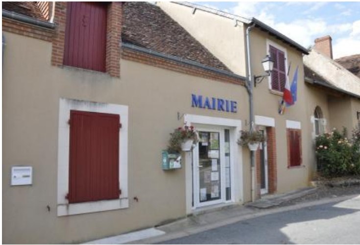
Mairie de Chavin