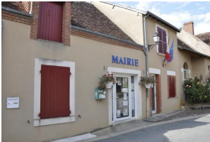
Mairie de Chavin