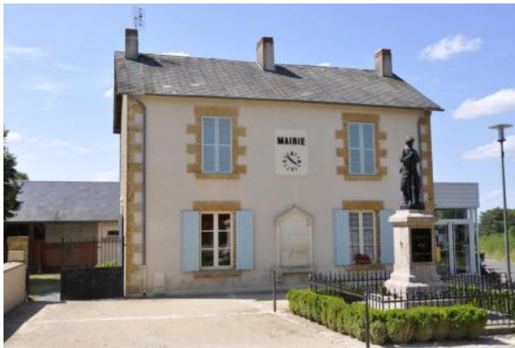
Mairie de Dunet