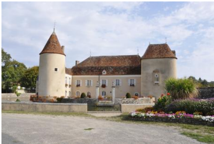
Mairie du Pêchereau