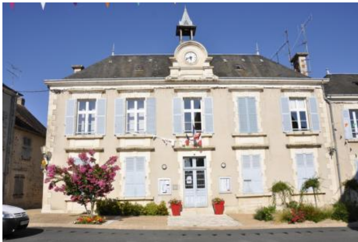
Mairie de Lignac