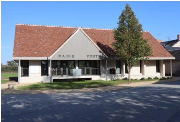
Mairie de Migné