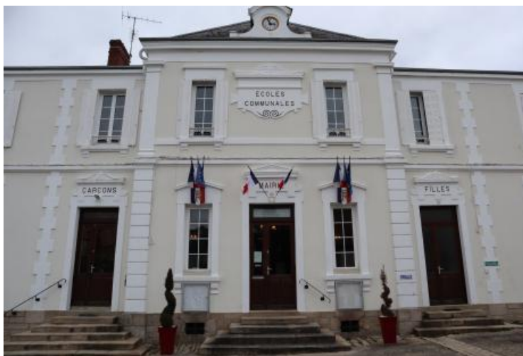
Mairie de Mouhet