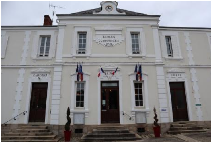
Mairie de Mouhet