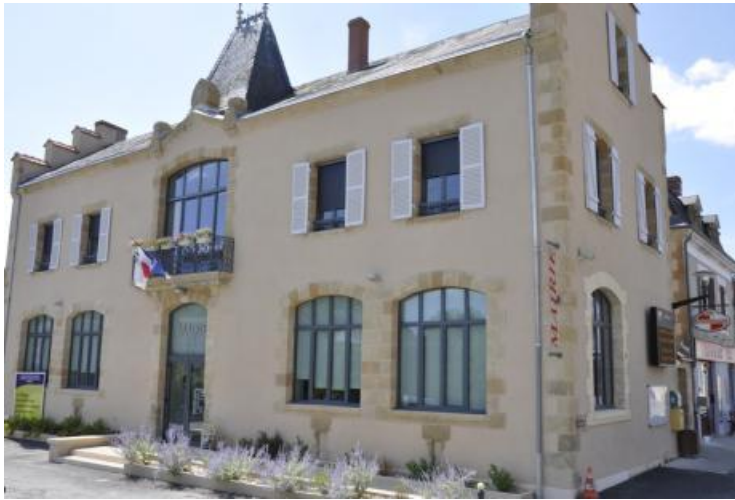
Mairie de Prissac