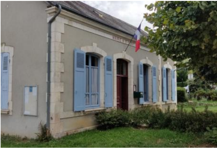
Mairie de Saint-Aigny